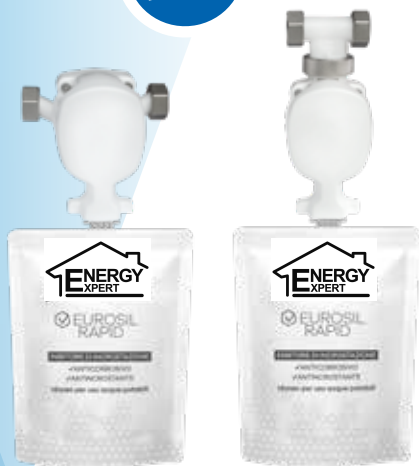
RAPID R 1/2"